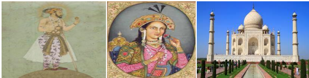
The Emperor Shah Jahan and his beloved wife, MumtazMahal

Shah Jahan, although devoted to his wife, is known as a cruel leader, who killed his brothers to make sure that he became Emperor. Eventually, in 1657, he was overthrown by one of his sons, and he spent the last 9 years of life locked up in a tower overlooking the TajMahal.